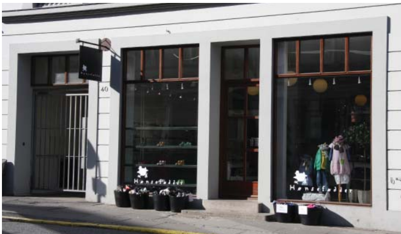
Diskret skiltning på vinduet, Bruunsgade, Århus