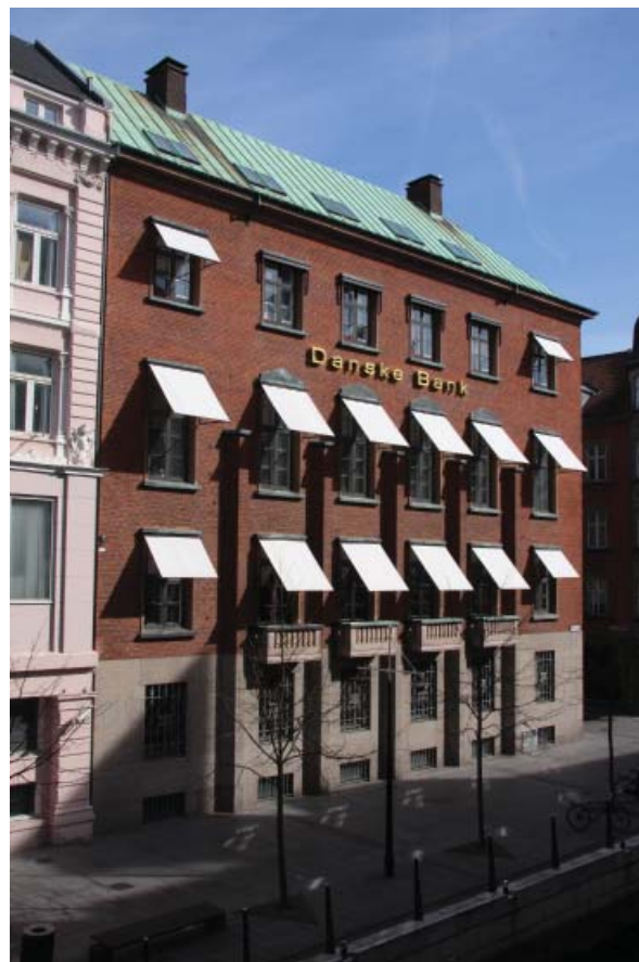
Ensfarvede markiser i Århus