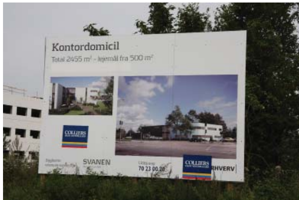
Midlertidig byggepladsskilt, som viser et muligt projekt