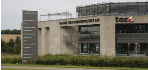
Samordnet fritstående skilt ved Viborgvej, Århus