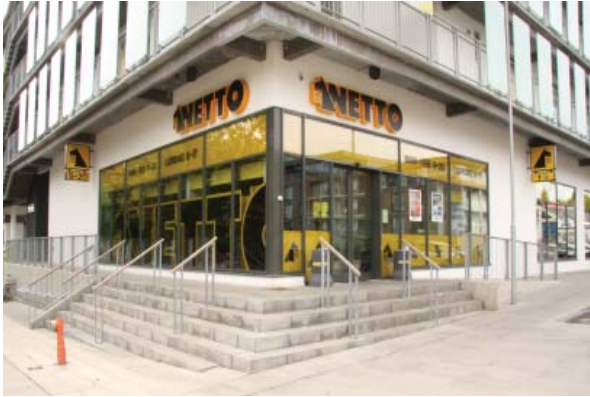
Netto ved Ringgaden i Århus