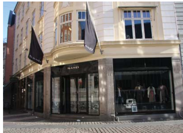
Herover: Tøjmærket Sands facade på Lille Torv i Århus