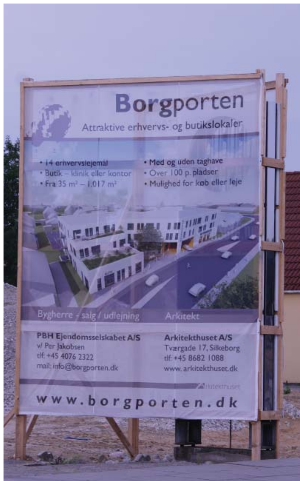
Byggepladsskilt opsat ved byggeplads i Silkeborg