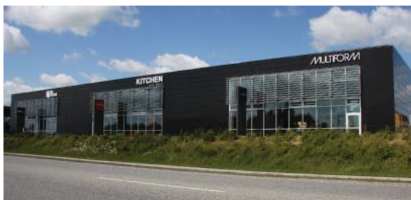
Samordnet skiltning på facade ved Viborgvej, Århus