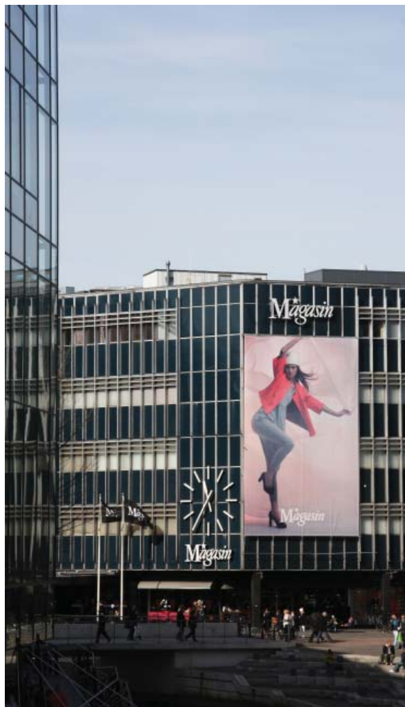
Til højre: Reklamebanner på Magasins facade i Århus