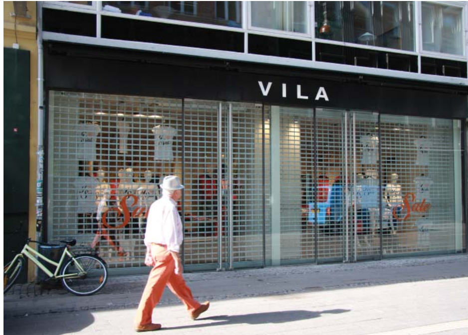
Indvendigt sikringsgitter på Strøget i København